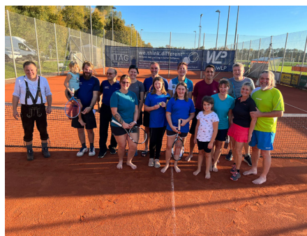
Oktoberfest im Herbst