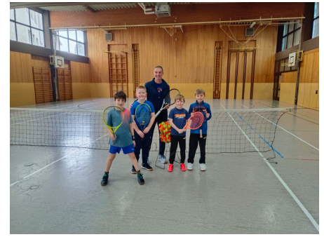
Kindertraining in der Turnhalle in Mauerkirchen

Falls Ihr Interesse am Tennis in Mauerkirchen habt schaut einfach am Platz vorbei. Neumitglieder können sich jederzeit auf www.tc-mauerkirchen.at anmelden. Dort findet ihr auch unsere aktuellen Mitgliedsbeiträge.