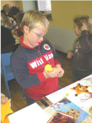
Jedes selbst gebasteltes Stück ist ein Unikat

Die Vorbereitungszeit auf Weihnachten ist eine schöne Zeit, um mit den Kindern für Advent und Weihnachten zu basteln. Mit dem liebevoll zusammengestellten Bastelprogramm des Elternvereins Mauerkirchen konnten die Kinder kreativ und schöpferisch sein. Zum Schluss blieb noch Zeit für ein gemeinsames Spiel - Twister ein beliebtes Spiel. Gespielt wurde mit ganzem Körpereinsatz auf einer Plastikplane, worin sich so manches Kind fast verknotete.