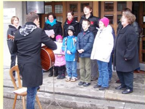
sangen schöne Weihnachtslieder - Pro Juventute Vierthalerhaus Mauerkirchen