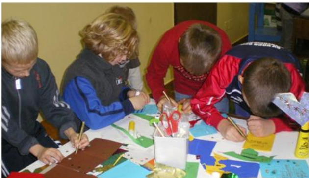
Mit viel Konzentration wurde das Wort „Weihnachten“ geschrieben