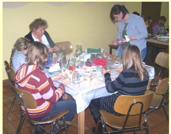
Weihnachtsbasteln und Weihnachtsgeschichten wurden vom Elternverein Mauerkirchen im Aufenthaltsraum angeboten