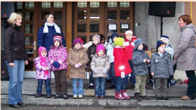
auch die kleinsten wollten ihre Künste präsentieren - Kindergarten Mauerkirchen mit den Pädagoginnen.