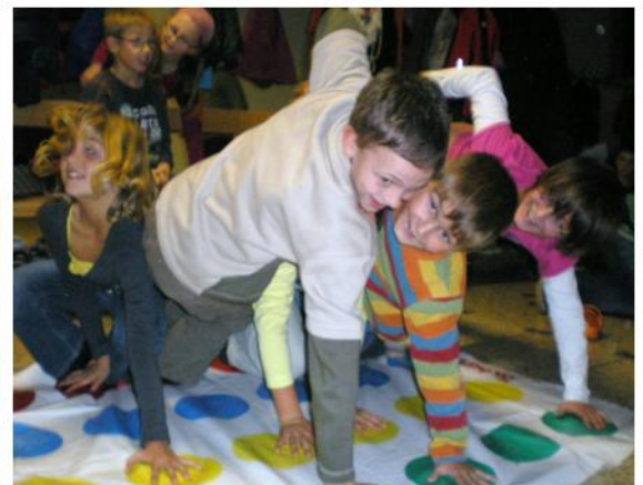
Ein ziemliches Durcheinander! Es war mitunter gar nicht so leicht bei dem Spielerknäul das Gleichgewicht zu behalten.