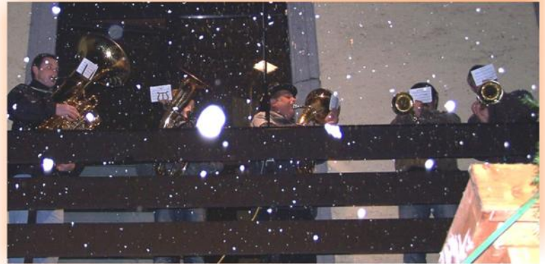
mussten während ihrer weihnachtlichen Stücke gegen starken Schneefall ankämpfen - die Bläsergruppe der Marktmusik Mauerkirchen