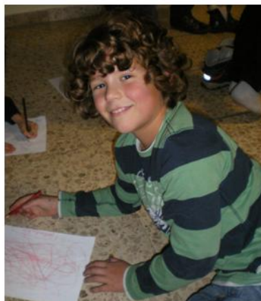
Zum Ausgleich wurde noch ein Bild gemalt, auch wenn nur noch der Fußboden überblieb