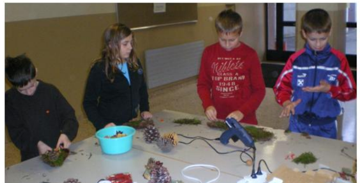
Durch die vielfältigen Naturmaterialien wurden prachtvolle Gestecke hergestellt