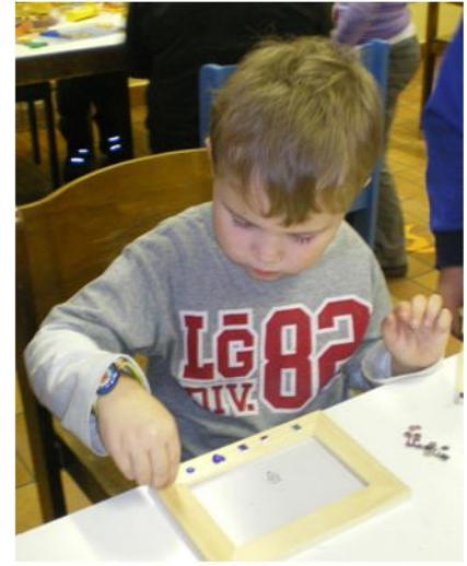
Jedes Steinchen hat seinen Platz