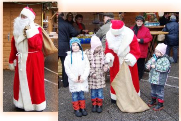
beschenkte die kleinen Kinder - unser Weihnachtsmann