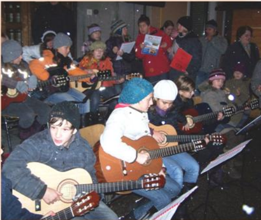
es war die größte Gruppe und lockte auch viele Zuseher an - die jungen Gitarristen von der Fun Gitarrenschule Mauerkirchen