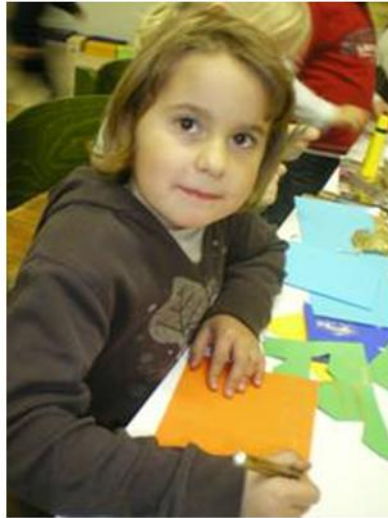
Faszinierend war es auch mit diesem Goldstift die Karten zu beschriften