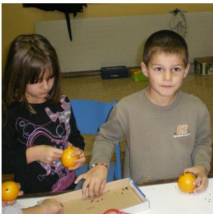
Die mit den Nelken besteckte Orange wird für den typischen Weihnachtsduft sorgen