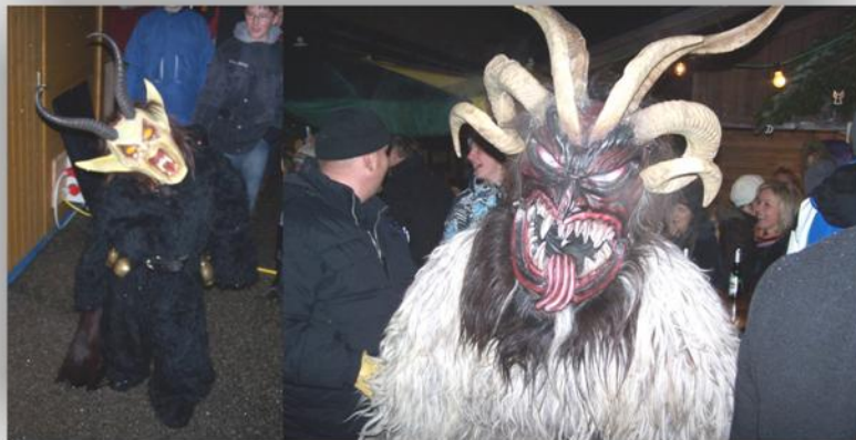
verwöhnten die Besucher mit zärtlichen Streicheleinheiten - die Perchten von der Gruppe Zeroxx-Pass Perchten